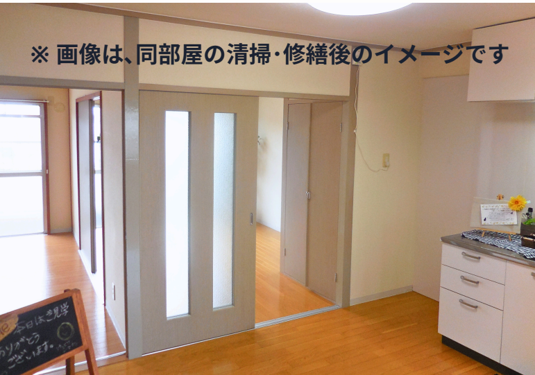
※ 画像は、同部屋の清掃・修繕後のイメージです